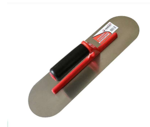
desempenadeira de borda arredondada